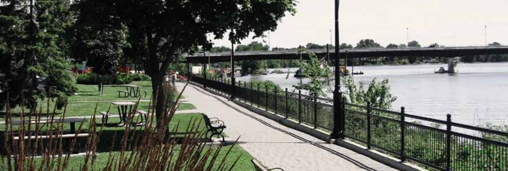
^ PROMENADE PAUL-SAUVÉ, SAINT-EUSTACHE