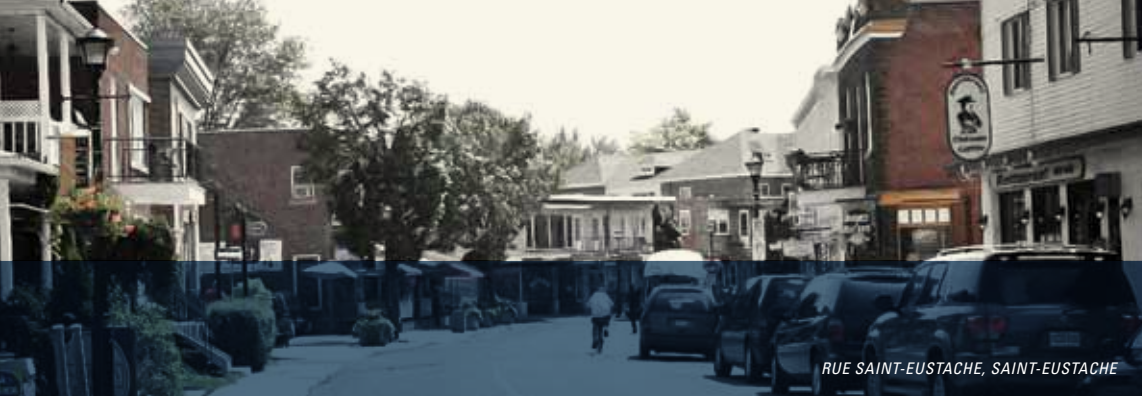
RUE SAINT-EUSTACHE, SAINT-EUSTACHE