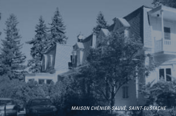
MAISON CHÉNIER-SAUVÉ, SAINT-EUSTACHE

PROFIL CULTUREL Nous savons que de nombreux artistes habitent la région, même s'il est encore difficile d'en répertorier l'ensemble. Ils pratiquent dans différents domaines artistiques, mais l'importance de la catégorie des arts visuels se doit d'être soulignée. Plus d'une cinquantaine d'organismes culturels contribuent à l'enrichissement de la vie culturelle grâce à leurs activités de recherche, de diffusion ou de formation. Ils œuvrent dans différentes disciplines comme le patrimoine, la généalogie, la peinture, la sculpture, la photographie, l'horticulture, le théâtre, le cirque, la musique, la danse et bien plus encore. Ce sont majoritairement des organismes à but non lucratif, mais il faut ajouter à cela une coopérative d'artisans. Plusieurs entreprises privées en culture sont également présentes dans la MRC et offrent des services de formation et de loisirs culturels à la population.