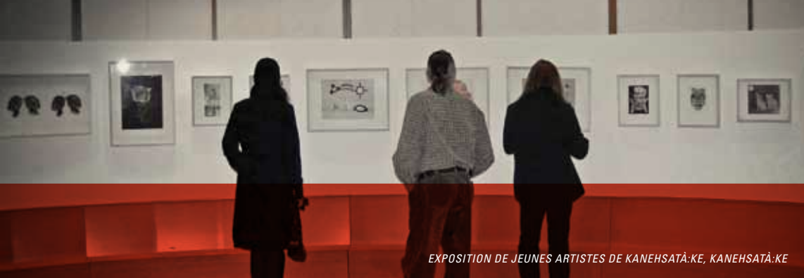
EXPOSITION DE JEUNES ARTISTES DE KANEHSATÁ:KE, KANEHSATÁ:KE