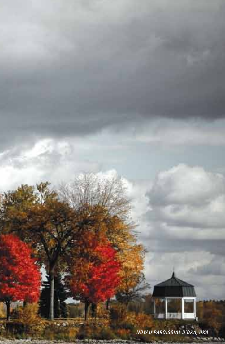
NOYAU PAROISSIAL D'OKA, OKA

«LA CULTURE, C'EST LA MÉMOIRE DU PEUPLE, LA CONSCIENCE COLLECTIVE DE LA CONTINUITÉ HISTORIQUE, LE MODE DE PENSER ET DE VIVRE».