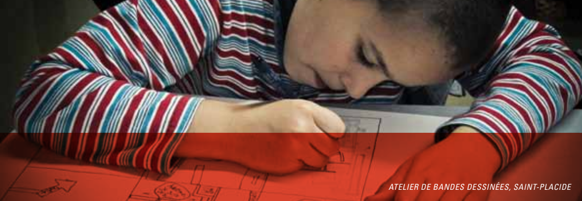
ATELIER DE BANDES DESSINÉES, SAINT-PLACIDE